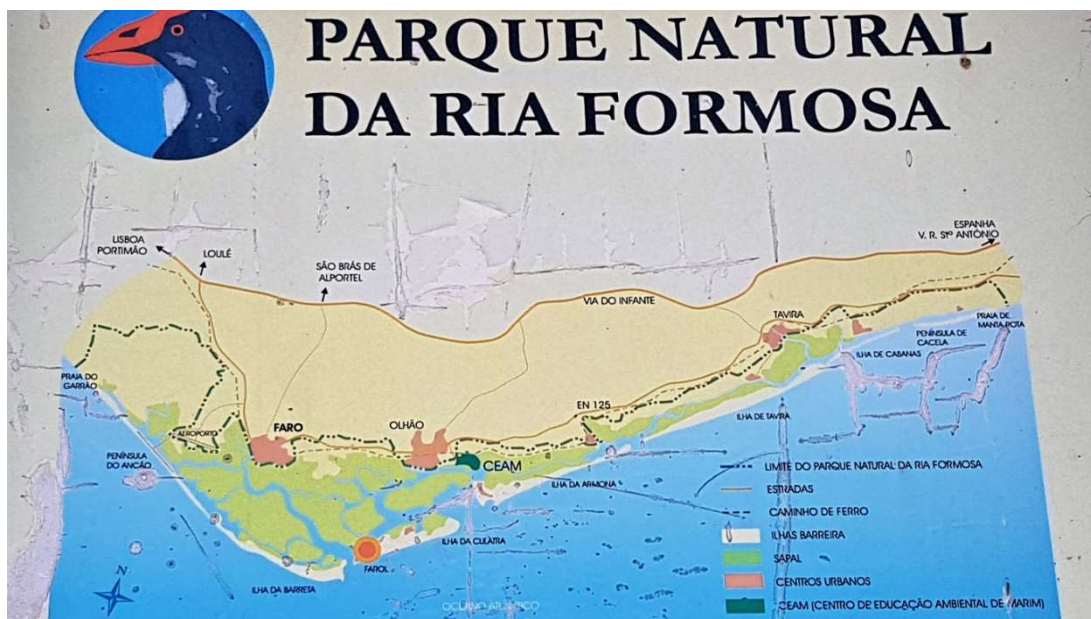
A fenti képen a Természeti Park térképe, lent az Ilha da Barreta „kikötője”.