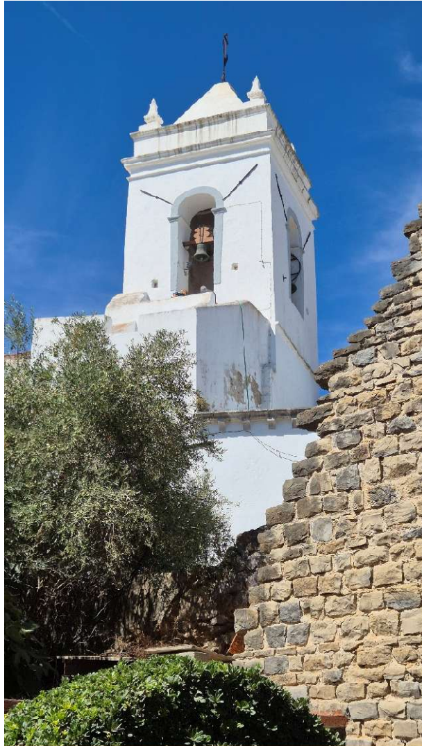
A templom harangtornya a Vár felől