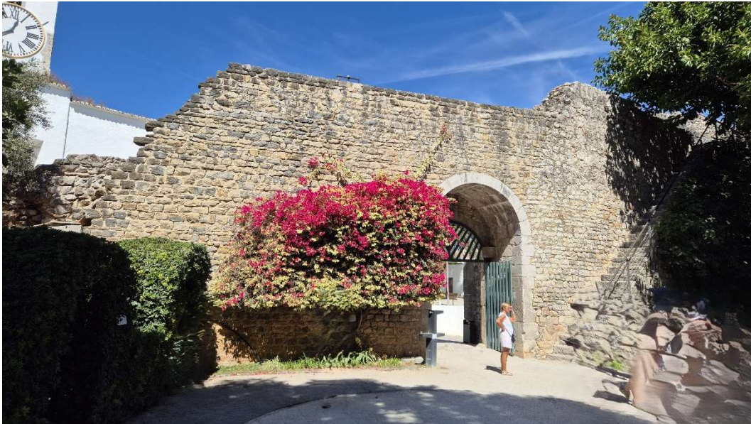
A Vár udvara