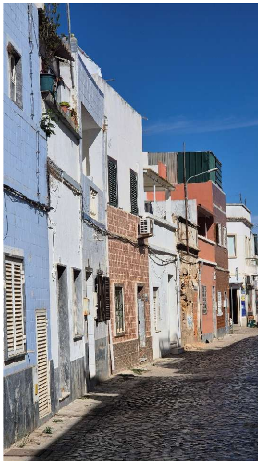
Tipikus utcakép a Medinában.

Két teljes napig alkalmazkodtunk a helyi szokásokhoz: minden este más étteremben vacsoráztunk, iszogattuk a kiváló helyi borokat.