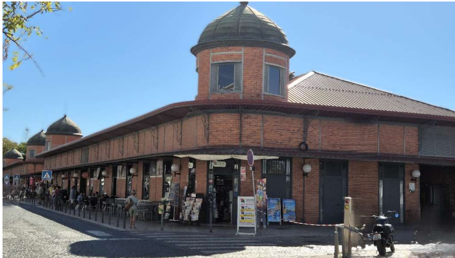
Az Óceán parton álló piac épülete

a helyi sör mellett nézik a Naplementét. Itt kiválóan lehet „semmit tenni” és „azonnal várni”.