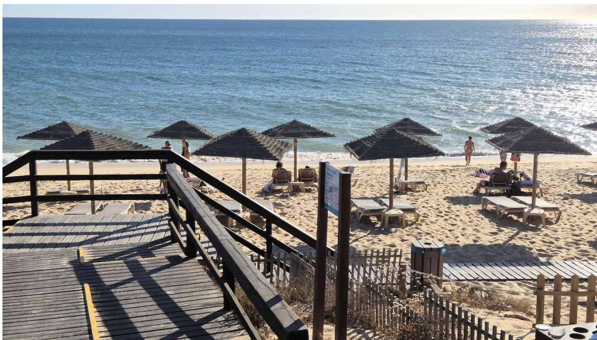
Praia de Alcão

Portugália déli gyöngyszeme: kultúra, történelem és természeti szépségek