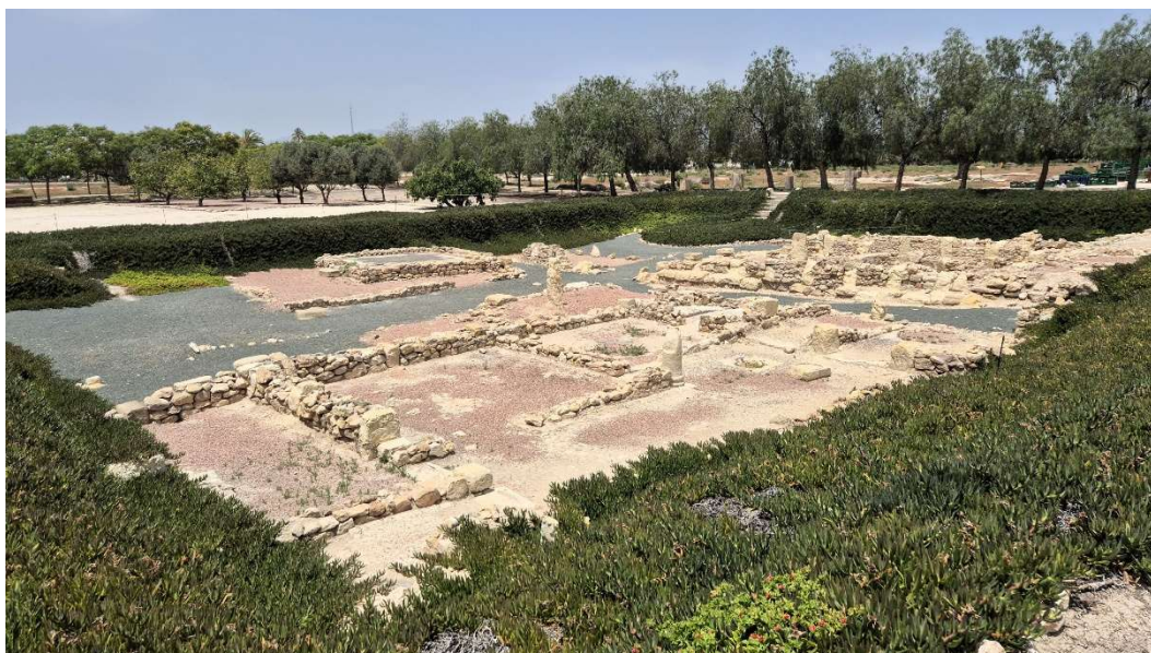
La Alcudia római kori központja

Spanyolországi kirándulásaim során eddig nem találkoztam a rejtélyes „ibérekkel”, ezért is érdekelt La Alcudia archeológiai lelőhely Elche közelében. Sokat ne várjunk a látogatástól, és akkor nem fogunk csalódní. Én nem voltam ennyire óvatos, meg aztán 35 fok is volt a déli órákban. Így a nem túl látványos romok közötti sétát a minimumra szorítottam. Ugyanakkor ez egy kiváló alkalom, hogy közelebbről is megismerkedjünk az ibérekkel, különösen a Spanyolországban világhírű Dama de Elche-vel.