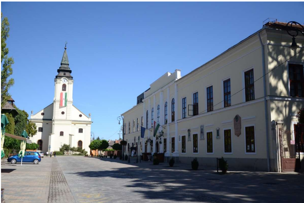
1. ábra: A szarvasi evangélikus ótemplom és a Tessedik Múzeum 1